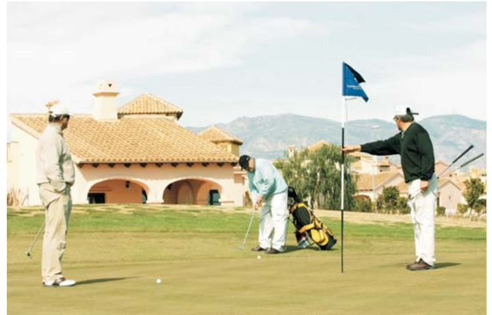
LOS INGENIEROS TÉCNICOS AGRÍCOLAS MURCIANOS TIENEN EN LA GESTIÓN DE CAMPOS DE GOLF UNA NUEVA OPCIÓN PROFESIONAL