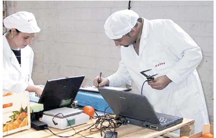
LOS INGENIEROS TÉCNICOS AGRICOLAS SE OPONEN AL REAL DECRETO 520/2006 POR CONSIDERARLO "DISCRIMINATORIO"

"Así mismo consideramos que coarta la competencia del libre mercado obligando al agricultor a ser asesorado por