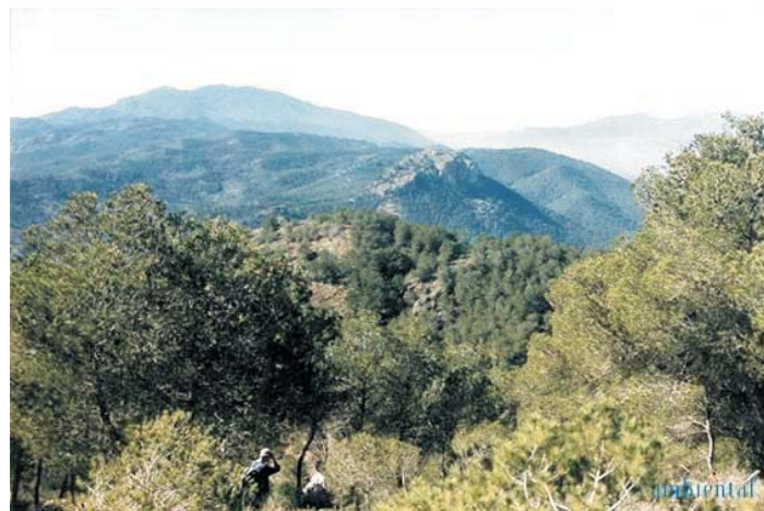
EL MEDIO AMBIENTE EN LA REGIÓN DE MURCIA, UNO DE LOS PRINCIPALES TEMAS DE INTERÉS PARA LOS INGENIEROS TÉCNICOS AGRÍCOLAS