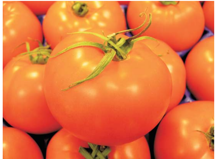
LOS PRODUCTOS HORTOFRUTÍCOLAS SERÁN ANALIZADOS EN EL III CONGRESO DE CALIDAD ALIMENTARIA QUE SE CELEBRARÁ EN MURCIA EN EL 2007

La celebración de todos estos eventos, tendrá lugar en el entorno privilegiado del Auditorio y Centro de Congresos "Víctor Villegas" de Murcia.