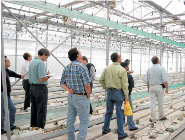
LA INDUSTRIA AUXILIAR, UNO DE LOS EJES FUNDAMENTALES PARA LA ECONOMÍA AGROALIMENTARIA MURCIANA